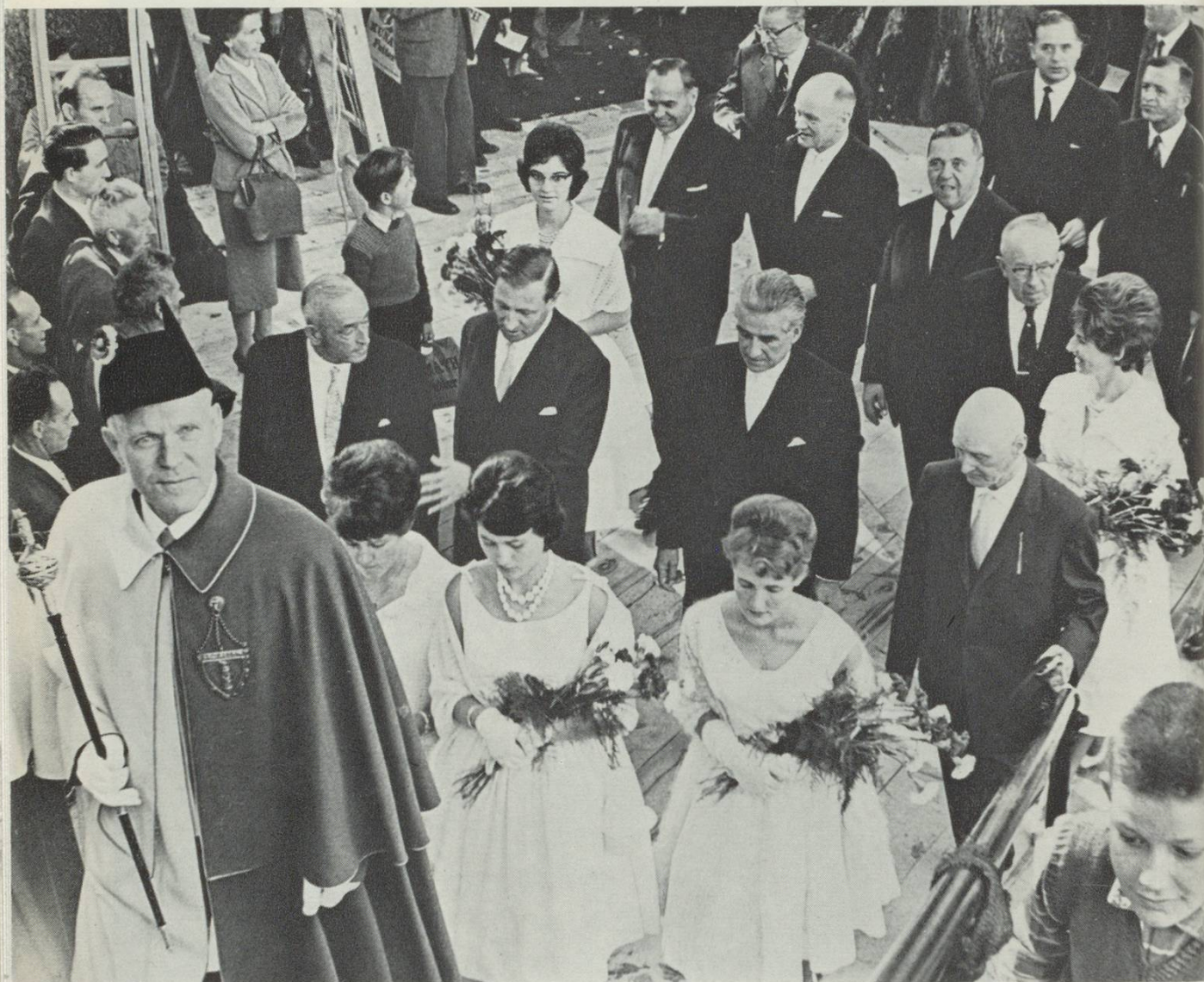
Die Olma-Eröffnung ist jedes Jahr ein Festtag für die Stadt. Vertreter des Bundes, der Kantone und der Stadt bei der Besichtigung der Olma 1961