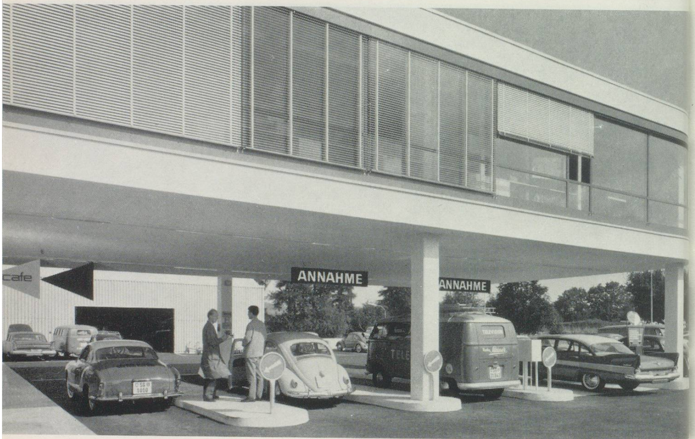
Die moderne City-Garage Lerchenfeld