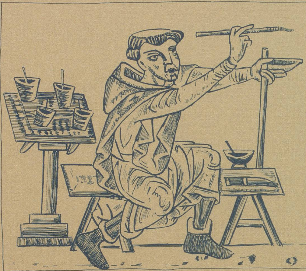
Mittelalterlicher Wandmaler bei der Arbeit

Künstlerische Gestaltung von Fassade und Raum in jeder modernen Technik sowie Ausführung sämtlicher Malerarbeiten, Schriften und Reklamen.