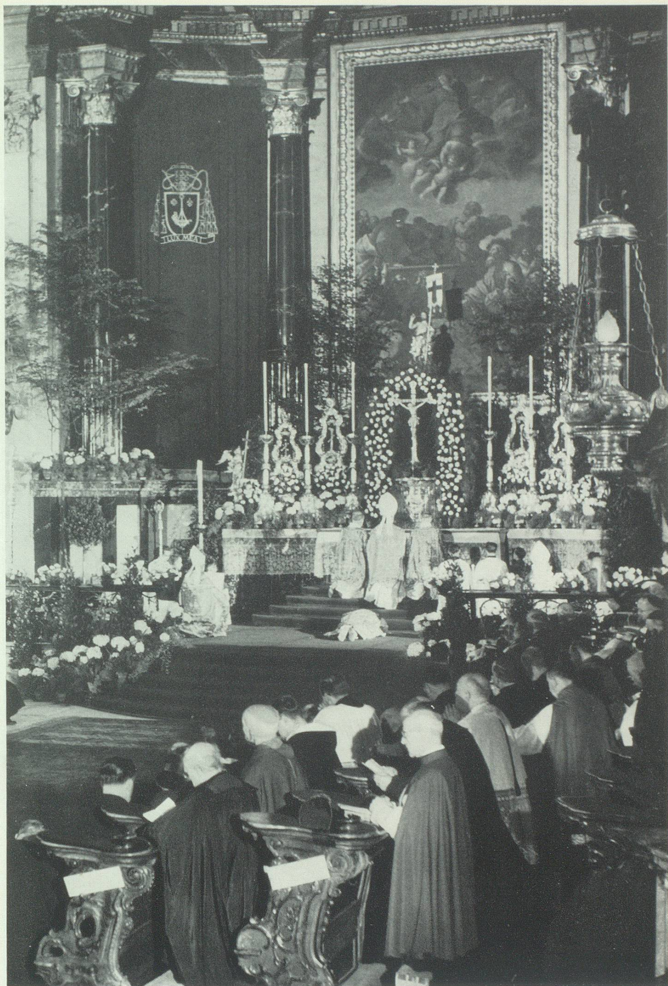
Die feierliche Bischofsweihe des neuen Landesbischofs Josephus Hasler