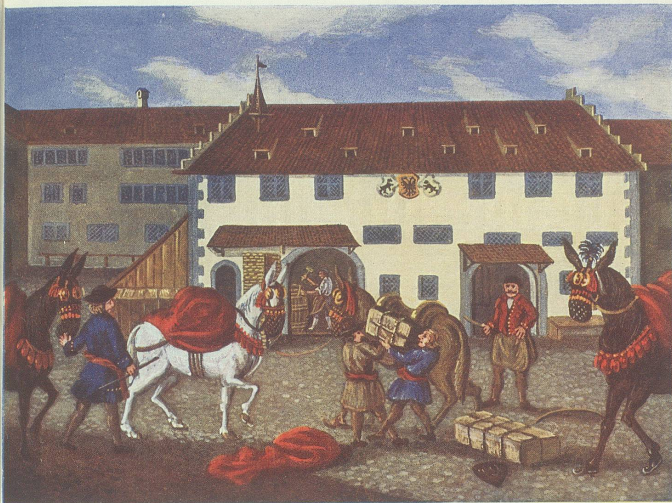
Leinwandtransport (Nach Aquarell von D. W. Hartmann)