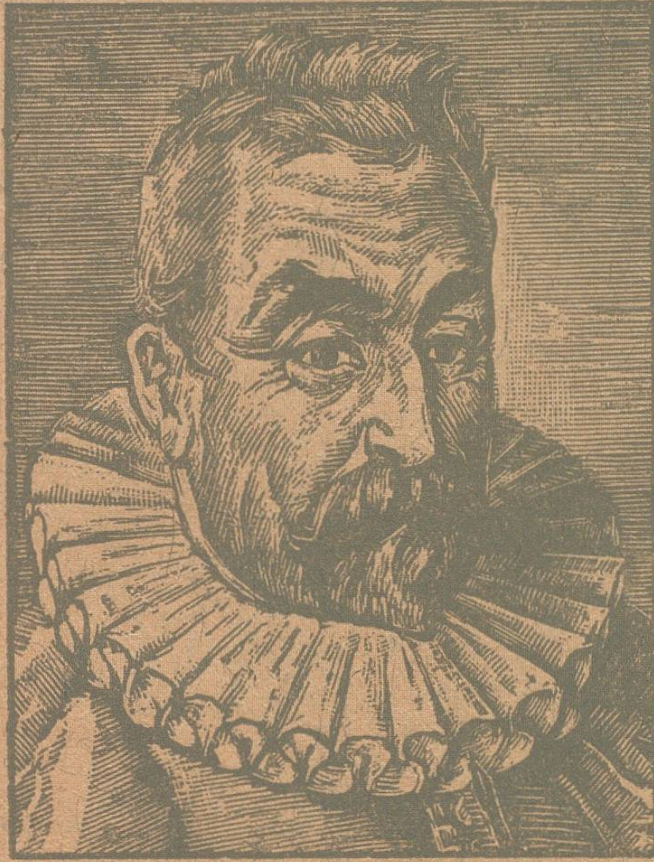
Jean Nicot brachte die Tabackspflanze nach Europa

Tabak, Tabak, Du edles Kraut! Der Mann sei lobenswert, Der dich gebaut! Der dich erbaut Und hat gepflanzt, Sei Lob und Ehr und Dank Sein Leben lang!