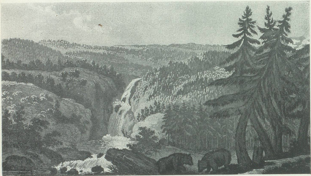
Die Gegend von St.Gallen im 6. Jahrhundert

Krankheiten anderer Art noch gesellten sich zur schreckenden Epidemie, und mehrere hunderte unserer Bewohner lagen wochenweis darnieder; ihrer eine große Zahl schmachteten Monate lang auf schmerzlichem Lager; und