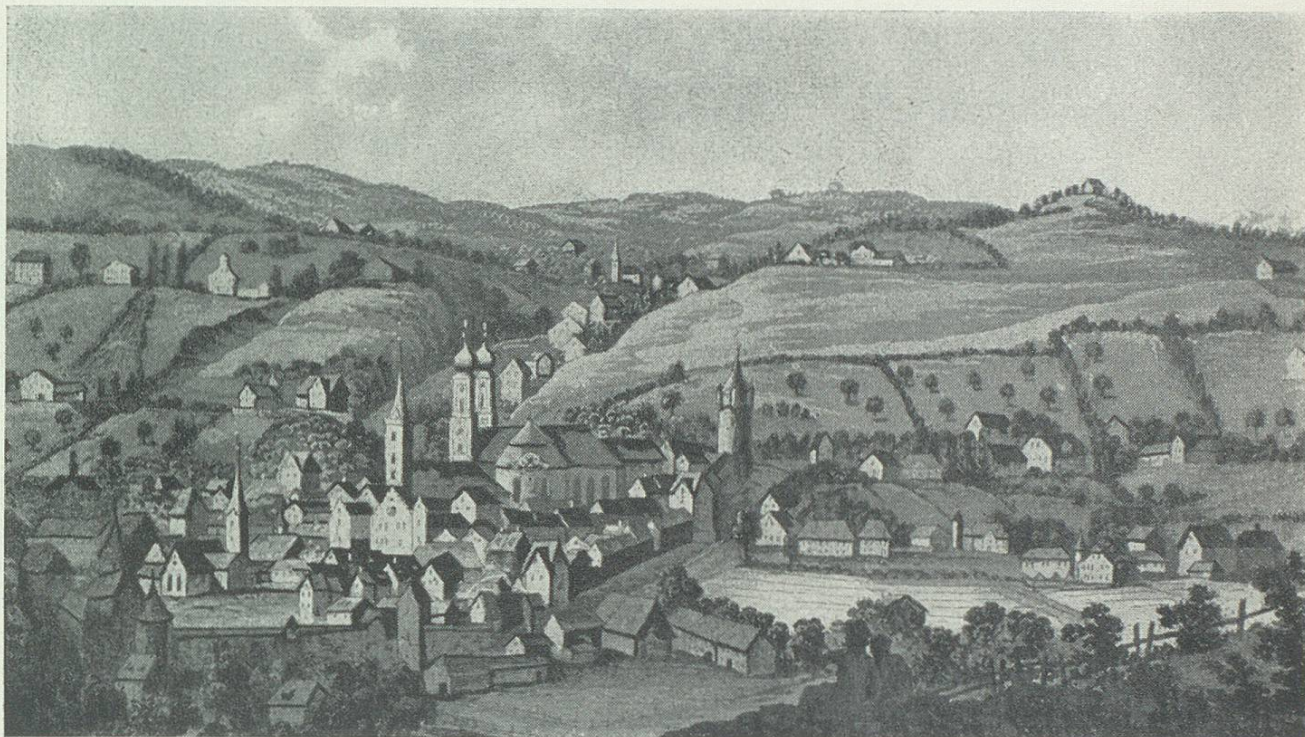
Die Gegend von St.Gallen am Anfang des 19. Jahrhunderts

des verhängnißvollen Jahres 1817 mehrere Schlachtopfer gefallen. In die Wohnungen unserer Begüterten und des Mittelstandes vorzüglich, war die schreckliche Krankheit und mitunter auch der Tod eingekehrt. – Wie schauerlich war dir, Vaterstadt! zu Muthe am Schlusse des vergangenen Jahres; wie ernst dein Übertritt in das neue, dunkle