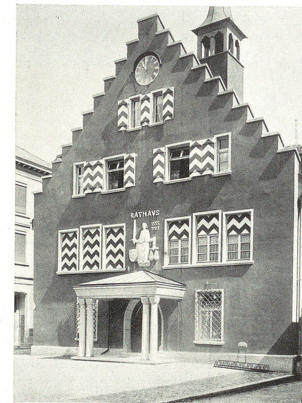
Rathaus in Rheineck

Am 3. März 1798 wurde das Rheintal von der Tagsatzung als freie eigene Landschaft erklärt, und am 1. Oktober zogen die Franzosen in Rheineck ein. Am Auffahrtstag 1799 mußten sie aber nach der für sie unglücklich verlaufenen Schlacht bei Feldkirch den nachrückenden Österreichern das Städtchen überlassen. Nach der zweiten Schlacht bei Zürich fluteten die geschlagenen Russen und Österreicher über den Rhein, und wieder am 1. Oktober marschierten