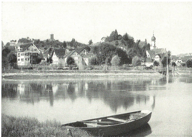
Blick auf Rheineck

nicht aber die ebenfalls neuerstandene Burg, mußte jedoch vor dem anrückenden Heerhaufen des Grafen v. Sulz schon nach zehn Tagen wieder abziehen.