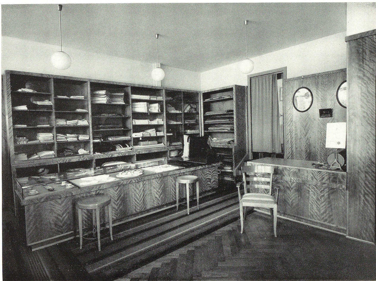
Ausgeführt nach den Plänen von A. Lang , Architekt, St. Gallen, in kanadischem Birkenholz