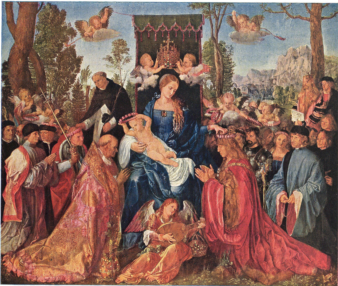
Das Rosenkranzfest nach dem Gemälde von Albrecht Dürer

Vierfarbendruck der Buchdruckerei Zollikofer & Co., St. Gallen