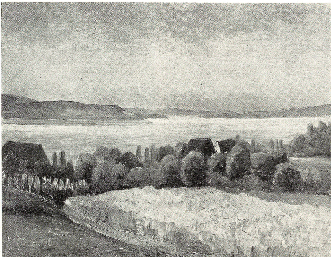
Blick auf das Schweizerufer von der Insel Reichenau

Nach einem Gemälde von W. Thaler, St. Gallen