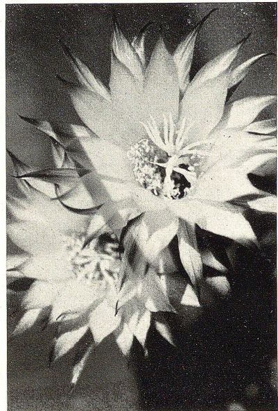
Zirka \frac{1}{2} natürlicher Größe

So rasch wie diese Wunderblüte entstand, so kurz ist auch ihre Lebensdauer. Zwei, drei Tage später ist die ganze Herrlichkeit schon wieder am Verwelken, Blüten und Stengel neigen sich erdwärts. Es bleibt nur noch ein grünes, mit vielen winzigen Haarbüscheln besetztes, kolbenförmiges Gebilde an der Stachel-Achse sitzen; das ist der Fruchtknoten, der, wenn die Blüte nicht bestäubt worden ist, sich spurlos ablösen läßt. Und schon freut man sich wieder (heimlich) auf das Werden neuer Wunderblüten.