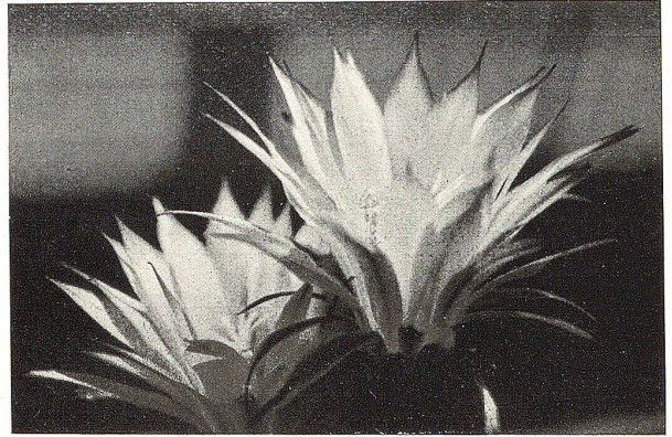
Zirka \frac{1}{2} natürlicher Größe

Das Bild des ganzen Igel-Kaktus mit den soeben sich öffnenden Knospen wurde etwa 24 Stunden vor den andern Bildern aufgenommen. Die völlig entfalteten Blüten sind weiß wie Schnee, leicht schimmernd, und zeigen zarte Lila-Schattierungen an den Spitzen. Tief liegt der Grund des Kelches, aus dem sich eine Menge von Staubfäden und ein Stempel eigenartiger Form erheben. Ein ganz exotisch berauschender