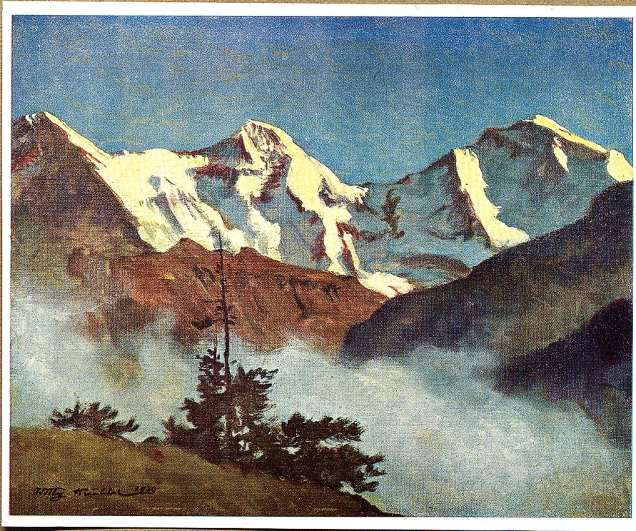
Jungfraugruppe von Beatenberg aus Farbendruck nach einem Oelgemälde von Willy Müller