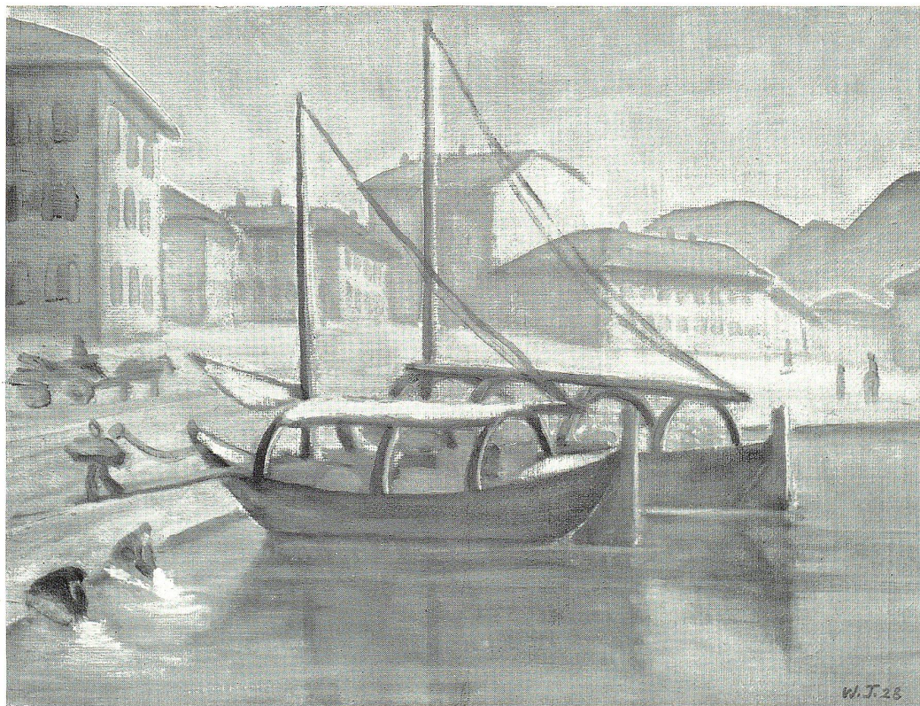
VENEDIG. Nach einem Gemälde von W. Thaler, St.Gallen.