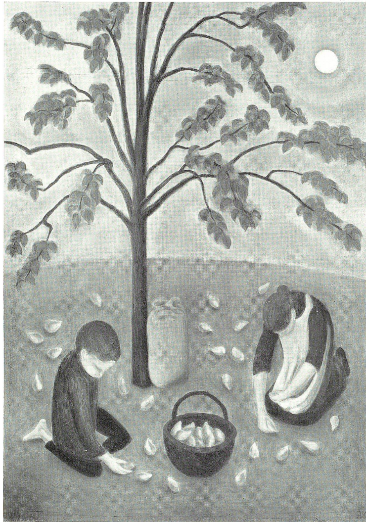
HERBST. Nach einem Ölgemälde von Bruno Kirchgraber, Gais.