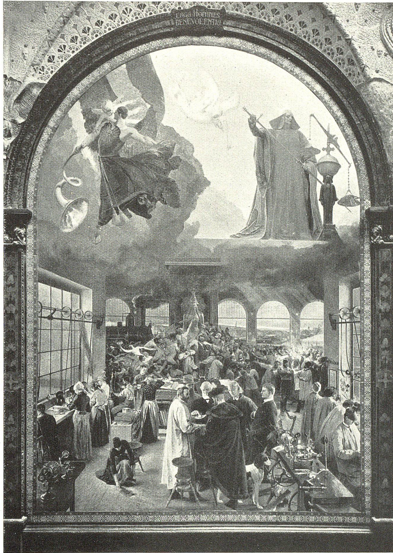
Allegorisches Triptychon von Paul Robert.

will der Herr walten lassen mit den Opfern der eigenen Habgier. – Diesem ergreifenden Bilde gegenüber ist dasjenige, wo Mutter Natur in lieblicher Frauengestalt, leichtschwebend ihr Füllhorn ausschüttet über die Erde. Von berückendem Reize ist das Gelände mit frischgrüner Aue, Fruchtfülle und Blumenpracht. (Wie beglückend scheint hier das wonnig-schöne Neuenburger Land vom Maler festgehalten!) Ein reizendes Heimwesen, beschauliche Wanderer auf der einen Seite; vor der himmlischen Gestalt aber fliehen zwei – der Geist des Bösen jagt mit dem ewig tätigen Teufel hinweg aus diesen Gefilden des Friedens und der Weihe. – Das Mittelbild endlich, ganz visionär gefaßt, führt den Beschauer ins Reich Christi – „das nicht von dieser Welt!“