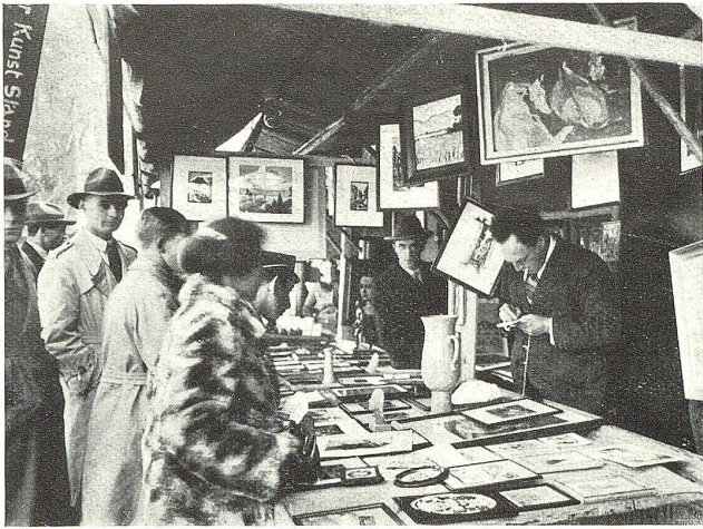
Das Kunstlager Sagakuffa auf dem St. Galler Herbstjahrmarkt.