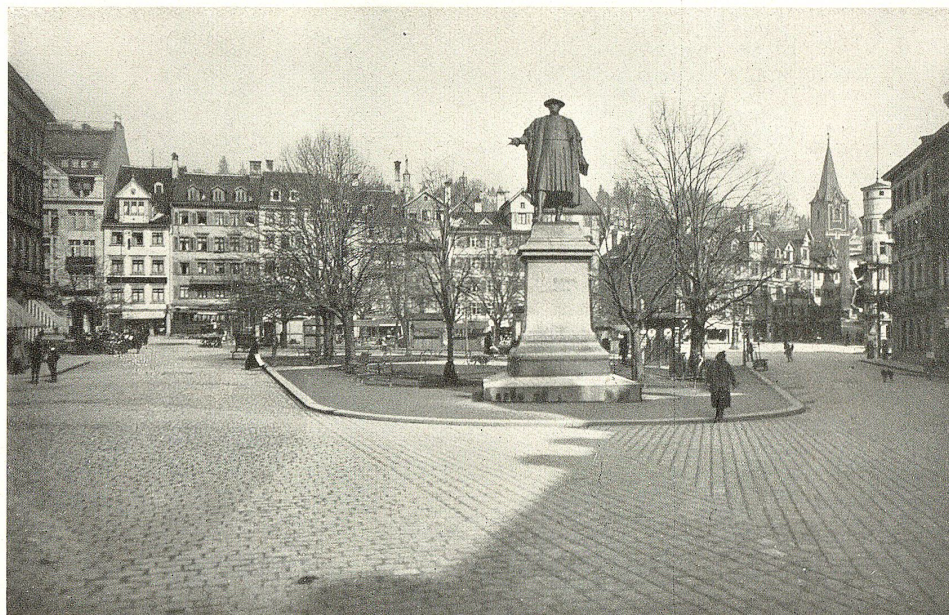
Der Marktplatz in St. Gallen mit dem Vadianenkmal.