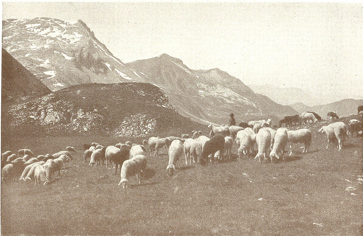
Schafherde im Engadin.