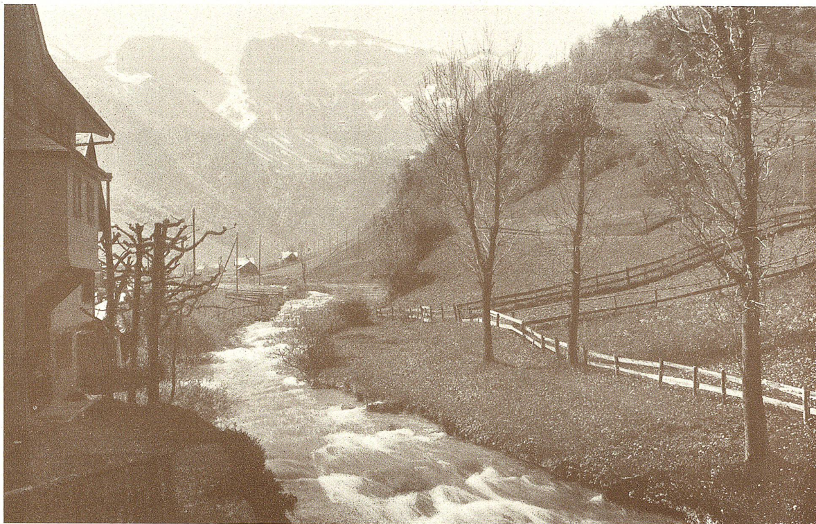
Auf dem Wege zum Seealpsee.