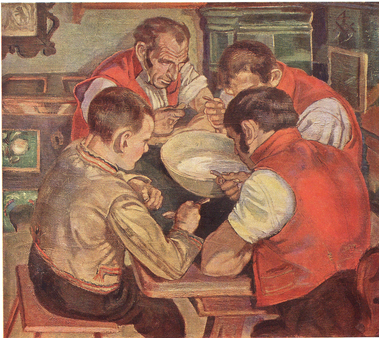
Appenzeller Milchsuppe. Nach einem Oelgemälde von Seb. Oesch †

Chromodruck der Buchdruckerei Zollikofer & Cie.