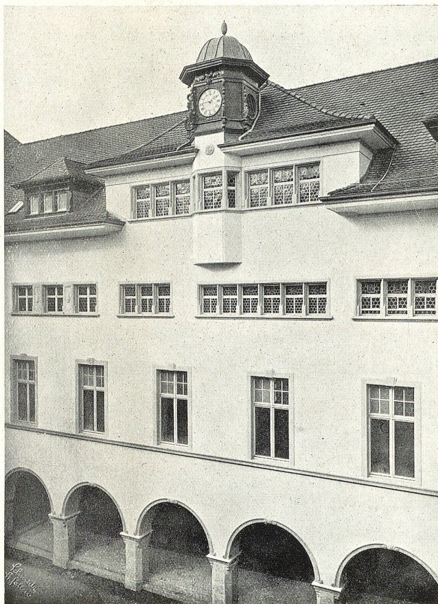
Neues Museum in St. Gallen: Hoffassade.

In der Ecke spendete einst der behäbige Turmofen seine milde Wärme. Er bildet mit seinen fa- tig grünen Kacheln, deren Wir- kung durch Rosetten in schwar- zer Tinktur noch erhöht wird, ein hervorragendes Meisterstück der Winterthurer Ofenbaukunst, aus deren Werkstätten er zwei- fellos hervorgegangen ist. Das charaktervolle, durch kräftige Zieraten belebte Mobiliar machte solche Räume erst recht zur behaglichen Heimstätte für das durch Solddienst und Han- del reich gewordene Bürgertum jener Zeit.» —