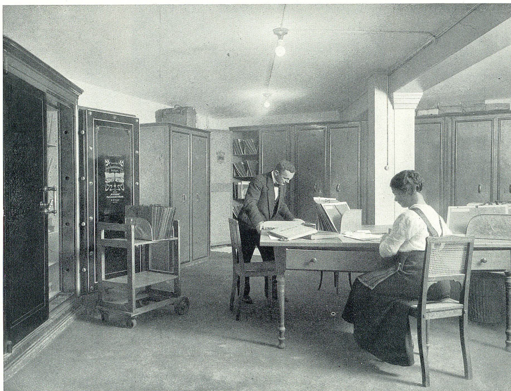
Stahlpanzerkammer für die Wertschriftenverwaltung

Zürich, Basel, Frauenfeld, Genf, Glarus, Kreuzlingen, Lugano, Luzern, Romanshorn, Weinfelden.