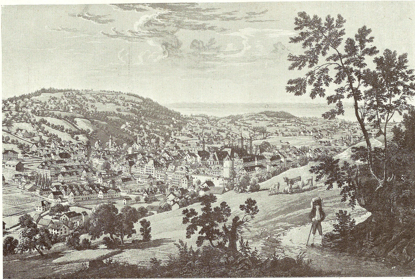
Die Stadt St. Gallen und Umgebung im Anfange des 19. Jahrhunderts. Nach einem gleichzeitigen Kupferstich von Iselin.