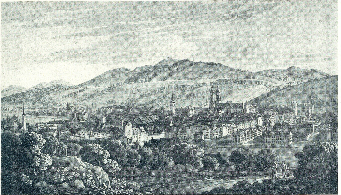
Nach einem Stich von J. P. Isenring.