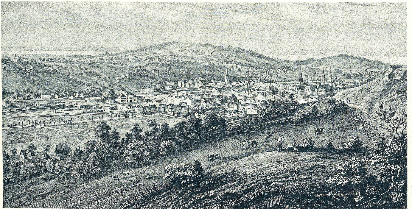
Nach einer Steinzeichnung.

Diese Bilder der Betriebsamkeit bietet unsre Stadt heute noch, besonders zur Mittagszeit, wenn die Menschenströme aus den Geschäften sich in die Straßen ergießen, und die Einförmigkeit ist auch geblieben und erquickt das Auge immer noch, ja immer mehr, nur in anderer Weise, nicht mehr liegend, sondern „hoch emporstrebend“.