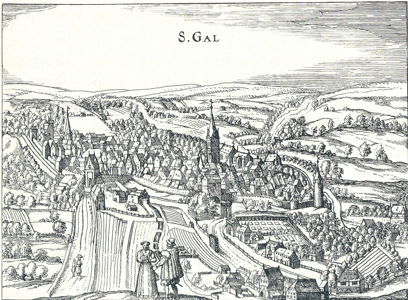
□ Eine der ältesten vorhandenen Ansichten von St. Gallen, etwa vom Jahre 1560. Nach einem alten Holzchnitt. □