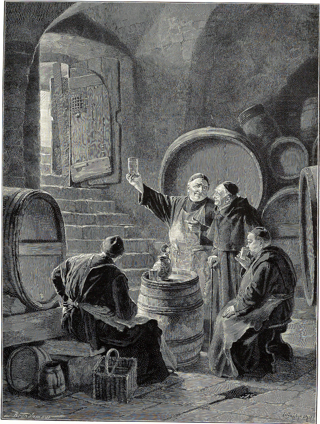
„Goldklar“. Nach dem Gemälde von Ed. Grützner .

Illustrationsdruckprobe der Zollikofer'schen Buchdruckerei.