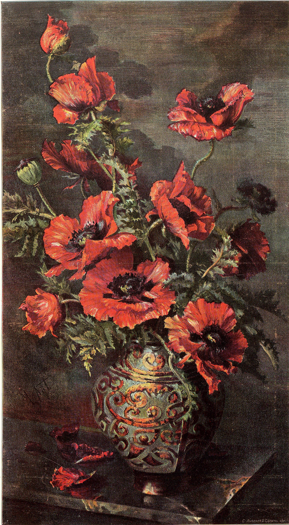
Farbendruck der Zollikofer'schen Buchdruckerei.