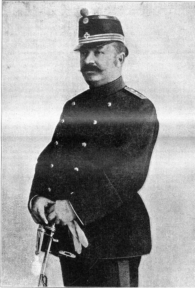
Oberst Ulrich Wille, Kommandant des III. Armeekorps.

Peter und Paul! Der feierliche Tag der Schutzpatrone, der ausschließliche Erwählten für das