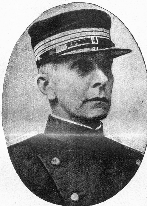
Oberst Sprecher von Bernegg Chef des schweizerischen Generalstabs.

Einsam und verlassen all die Stätten, worin die Müden ruhten im ewigen Schlaf. Die feierliche Stille durchbrach scharf und schrill das Sauchzen der Fiedel, das rohe, aufbringliche Brummen des Basses. Wie erschrocken flüchteten sich die kleinen Vögel ins dichtere Gezweig, und die weißen Lilien auf dem schönsten aller Gräber schienen zu erbeben auf ihren schlanken, hellgrünen Stengeln. Sie schwankten hin und her, und zwischen ihnen leuchteten goldene Worte auf weißgrauem Stein: