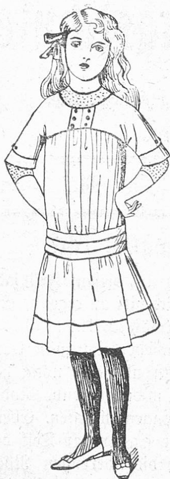
Fig. 3. Niedliches Kleid aus Wasch- oder Wollstoff für kleine Mädchen.

beliebten Foulards haben wir bereits berichtet; wir möchten noch hinzufügen, daß auch für diese leichten Seidengewebe, wie für Libertyseiden, die Streifenmuster in allen Breiten vorherrschend sind. Das heißt, das einfarbig dunkelblaue oder schwarze Gewebe ist in mehr und minder breiten Zwischenräumen mit feinen weißen Streifen bedruckt und durchwebt.