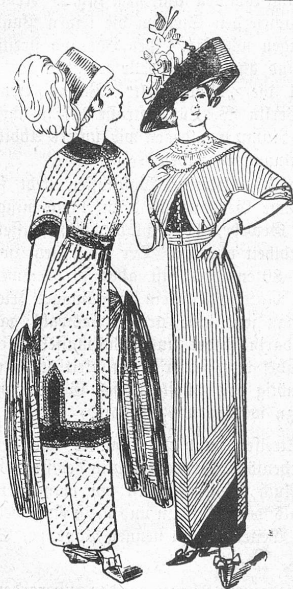
Fig. 1—2. Moderne Kleider aus Wollmousseline oder Foulardseide mit abstechendem Besatz.

Es gab in diesem Frühjahr im Modereich viel aufregende Ereignisse, allmählich klärt sich die Situation wieder und man lernt einsehen, daß niemand nötig hat sich eine ihm widerstrebende Modeform aufzwingen zu lassen. Eben- sowenig wie ein großer Teil der Damenwelt die überengen Röcke sich zu eigen machte, ebenso oder noch weniger werden sie dem Hosenrock Gefolgschaft leisten. Uebrigens gibt es heute schon recht vernünftige Formen des ominösen Kleidungsstückes, das häufig nur die Stelle des sonst üblichen Futterrockes vertritt, so daß der Oberrock tunikaartig geschlitz- t lose darüber fällt.