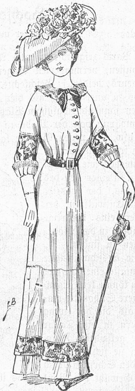
Fig. 4. Hochsommerkleid mit Kimonotaille.

Die hervorstechendste Modeneuheit sind die buntfarbig seidenen Tailleurs: kurz enge Röcke mit einem nur gerade die Hüften deckenden Paletot im Phantasieschnitt. Häufig