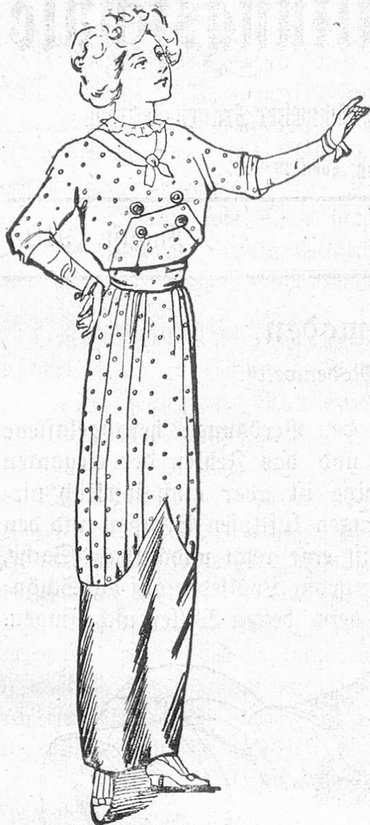
Fig. 3. Eine Toilette vom modernsten Schick.

lassen Revers und Manschetten das abstechend farbige Futter sehen, das Eleganteste sind jedoch die Kostüme aus rabenflügelblauem großgewässerten Moirée im schlichsten Schnitt, ohne irgendwelche Steppnähte, mit großen Knöpfen aus dem gleichen Stoff. Von dem Schick einer solchen Toilette kann man sich schwer einen Begriff machen, wenn sich ihr noch ein großer schwarzer Koffhaarghut mit glockenförmiger Krempe gesellt, dessen