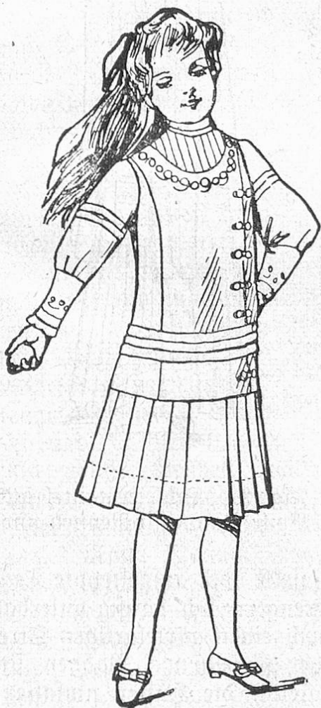
Fig. 1. Kinderkleid mit langer Taille. (Für Woll- und Waschstoffe geeignet.)

Paris. — Bei jedem Saisonwechsel sind unsere Erwartungen hoch gespannt und wir hoffen immer wieder, daß die Mode uns Nochnichtdagewesenes bringen wird. Kommt dann die Zeit heran, so stellt sich heraus, daß sich in gewohnter Weise das eine aus dem andern entwickelt, daß, was im Herbst und Winter angedeutet schien, zum Leitmotiv der Frühjahrstoiletten wird.