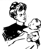
4000 Wer seine Kinder den Gefahren, die die jetzige Jahreszeit mit sich bringt, nicht aussetzen will, gebe ihnen das bekannte Milch-Mehl Galactina , das durchaus kein gewöhnliches Kindermehl, sondern ein aus keimfreier Alpmilch hergestelltes, leicht verdaulich gemachtes Milchpulver ist. Man hüte sich aber vor Nachahmungen und achte beim Einkaufensau auf d. Namen Galactina.

Alle Eltern und jeder Pädagog werden sich für dieses auf den neuesten Forschungen beruhende Kosmos-Bändchen interessieren. Im vergangenen Jahrhundert vollzog sich bekanntlich eine bedeutungsvolle Wandlung. Den Naturwissenschaften hat sich durch Herübernahme der biologischen Beobachtung und des Experimentes die Seelenkunde als ebenbürtige Wissenschaft zur Seite gestellt, und so wird das XX. Jahrhundert dereinstmals als das der Seelenkunde gefeiert werden müssen. Von den einzelnen Gebieten, die von den neuen Methoden zu erschließen begonnen worden sind, ist eines der wich-