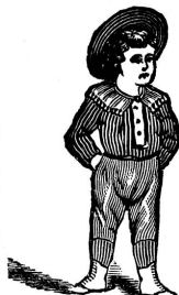
I WEAR THEM Jetzt