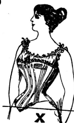
Ohne Gürtel: Starke Figur!

Zu beziehen durch die Gummi-Werkerei Hofman in Elgg (Kt. Zürich).