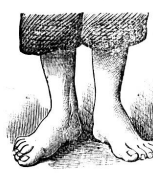
Nach der Behandlung.