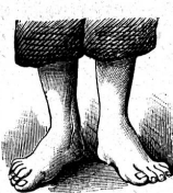
Nach der Behandlung

Zur gebotenen Erweiterung eines bestens eingeführten Geschäftes im Gebiete der Gesundheits- und Krankenpflege inklusive spezieller Frauenartikel ist die Verbindung mit einem tüchtigen und selbst- ständigen Frauenzimmer wünschenswert. Gute Verzinsung der Einlage und je nach Uebersichtlichkeit fixe Salarierung der zu leistenden Arbeit oder Anteil am Reingewinn. Es kann nur eine einsichtige und umgäng- liche Bewerberin berücksichtigt werden. Näheres wird ernsthaften Reflek- tantinnen gerne mitgeteilt. Offerten sind unter Chiffre AL 2314 an die Expedition zur gefl. Uebermittlung erbeten. [2314]