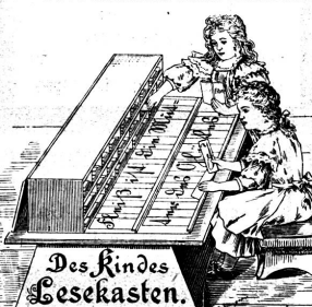
„Dem intelligenten Kinde ist er belehrend Spiel, Dem schwachbegabten aber ein Führer an das Ziel!“

ersten Schreibunterricht im Hause speciell für schwachbegabte Kinder und enthält 180 Täfelchen nebst 4 Lesetafeln.