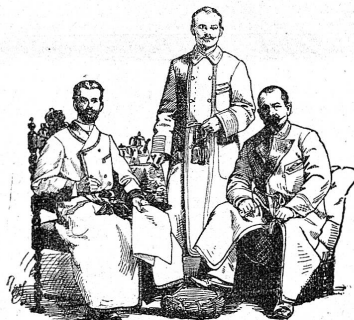
Façon 1. Façon 2. Façon 3.

Welche Artikel wünschen Sie bemustert? Prachtkataloge gratis und franko.