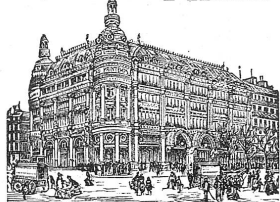
GRANDS MAGASINS DU