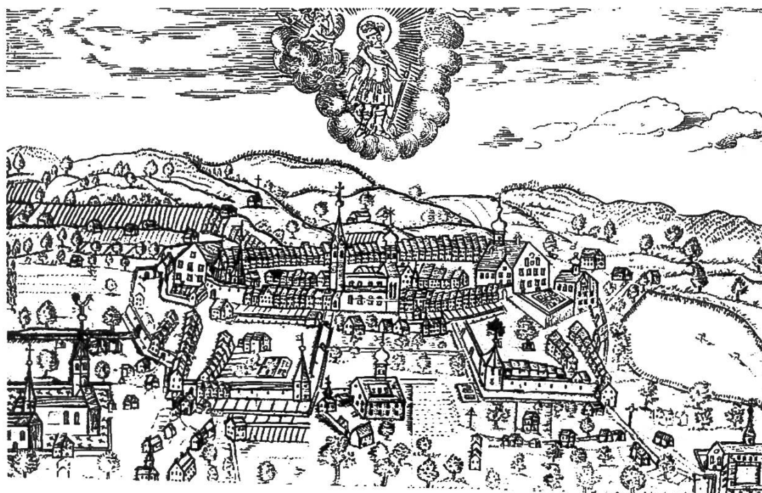
Abb. 2: Alter Stich von Wil