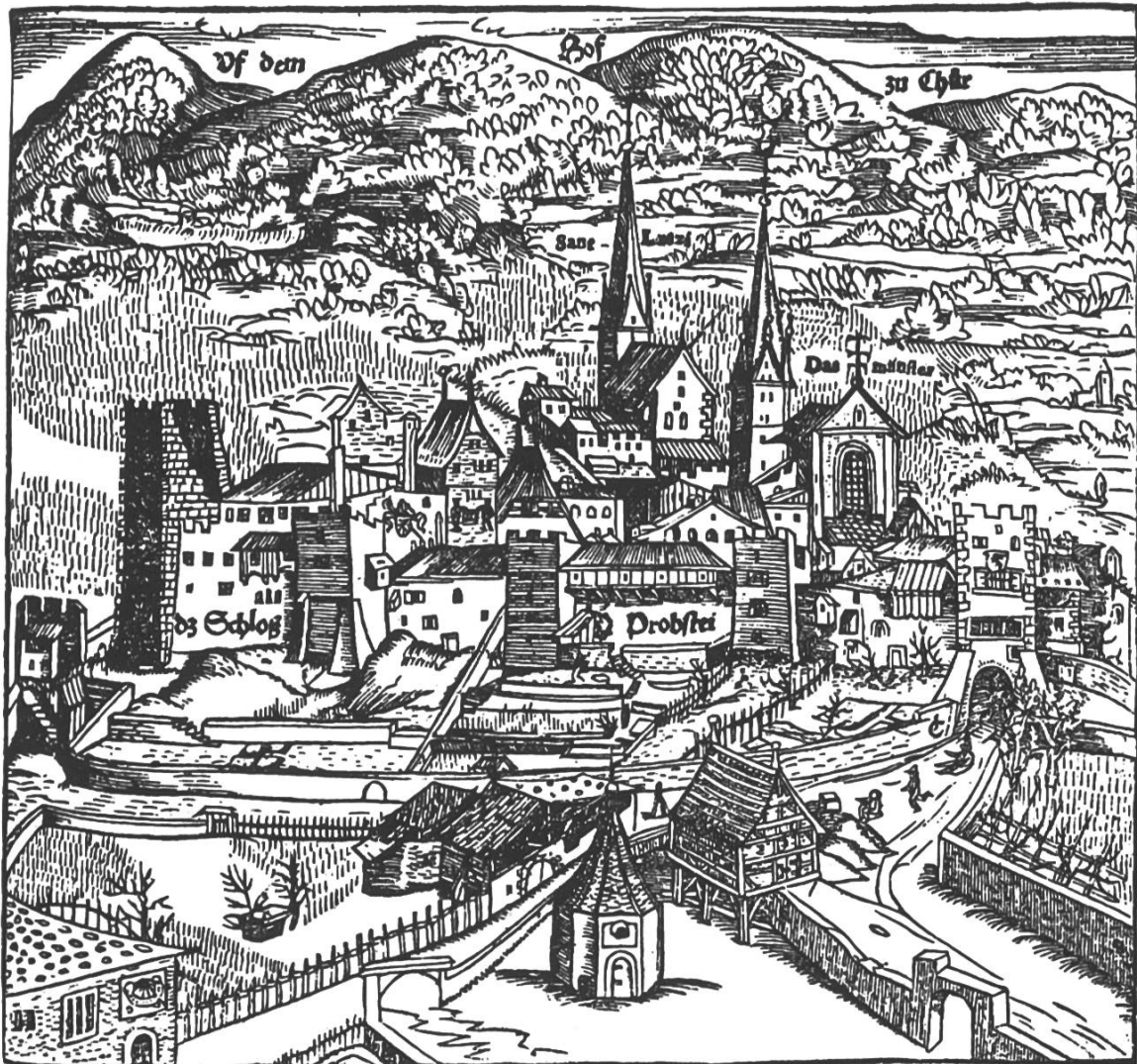
Abb. 10. Chur, «Der Hof» zu Chur. Aus der Cosmographie von Sebastian Münster, 1550.

In den Jahren 1150 – 1272 erfolgte der Neubau der Kathedrale und 1465 die Einführung der Zünfte. Chur war der Vorort des 1367 gegründeten Gotteshausbundes. Der Obere oder Grauebund wurde 1395 gegründet, der Zehngerichtebund 1436. Chur wurde in den Jahren 1464, 1574/76 durch Feuersbrünste heimgesucht. In Chur gab es viele Kirchen und Klöster die zT zerstört wurden. Die alte Kirche St. Martin ist seit der Reformationszeit 1523 – 1526 reformierte Stadtkirche. Pestzeiten gab es in den Jahren 1550 und 1629. 1639 wurde Jürg Jenatsch in Chur ermordet. Seit 1803 ist Chur Kantonshauptstadt des Kantons Graubünden.