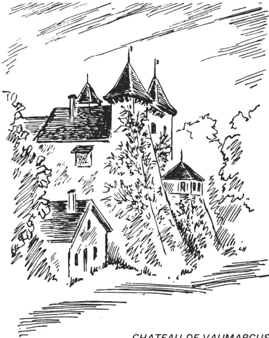
CHATEAU DE VAUMARCUS

Einladung zur Hauptversammlung 1988 in Neuenburg am 11./12. Juni 1988 Jubiläum: 50 Jahre Sektion Neuenburg