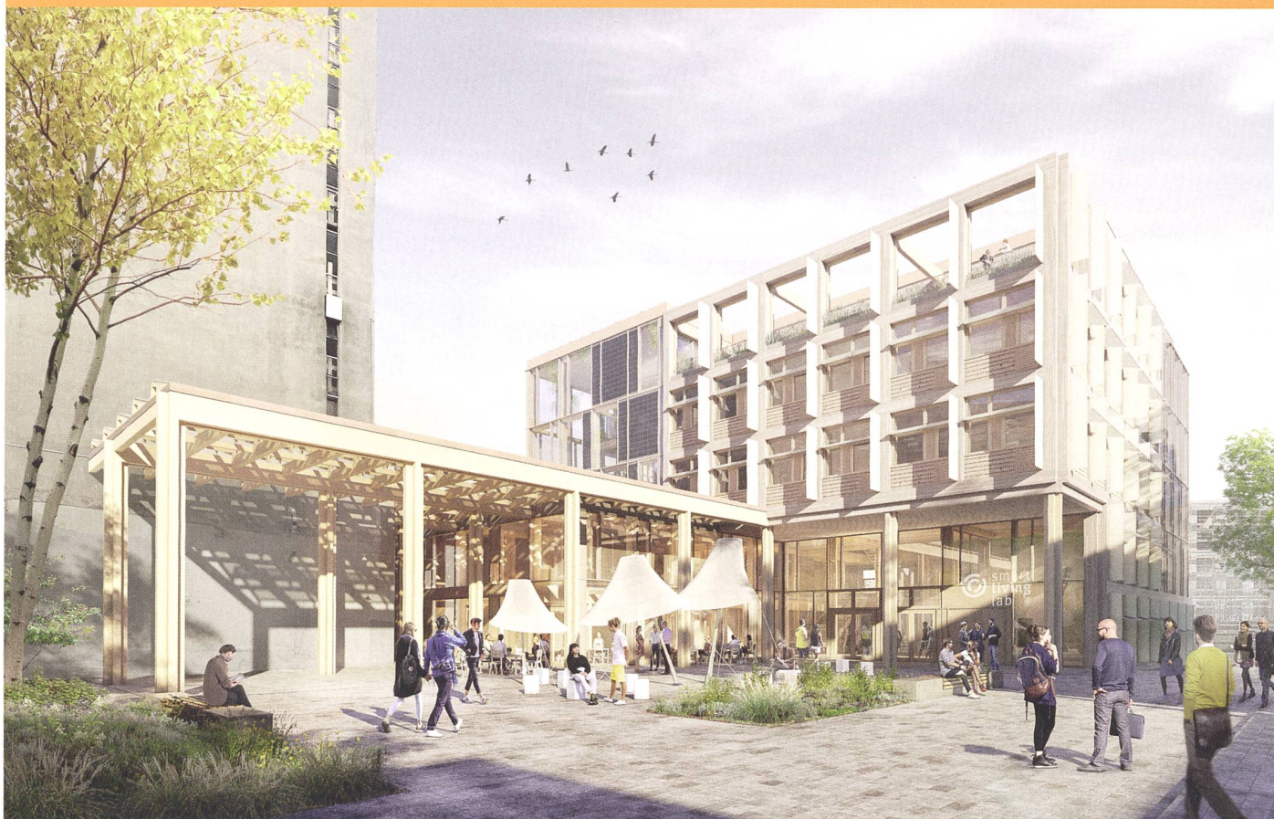
Image de synthèse du futur bâtiment du Smart Living Lab : façades sud et ouest.