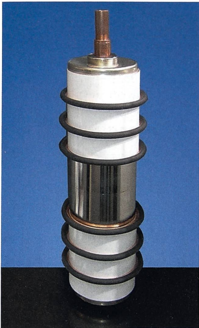
Bild 3 Die Vakuumschaltrohre.

nisse, keine Sättigung (im Gegensatz zu herkömmlichen Stromwandlern) und keine Ferroresonanzeffekte (im Gegensatz zu konventionellen Spannungswandlern).