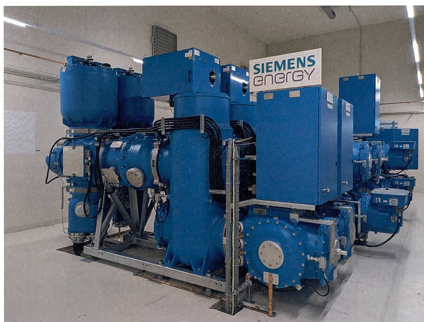
Bild 2 BlueGIS 145 kV im Unterwerk Uptown Basel.

Dieser wurde über eine digitale Schnittstelle per Prozessbus an die lokale Steuerung angeschlossen.