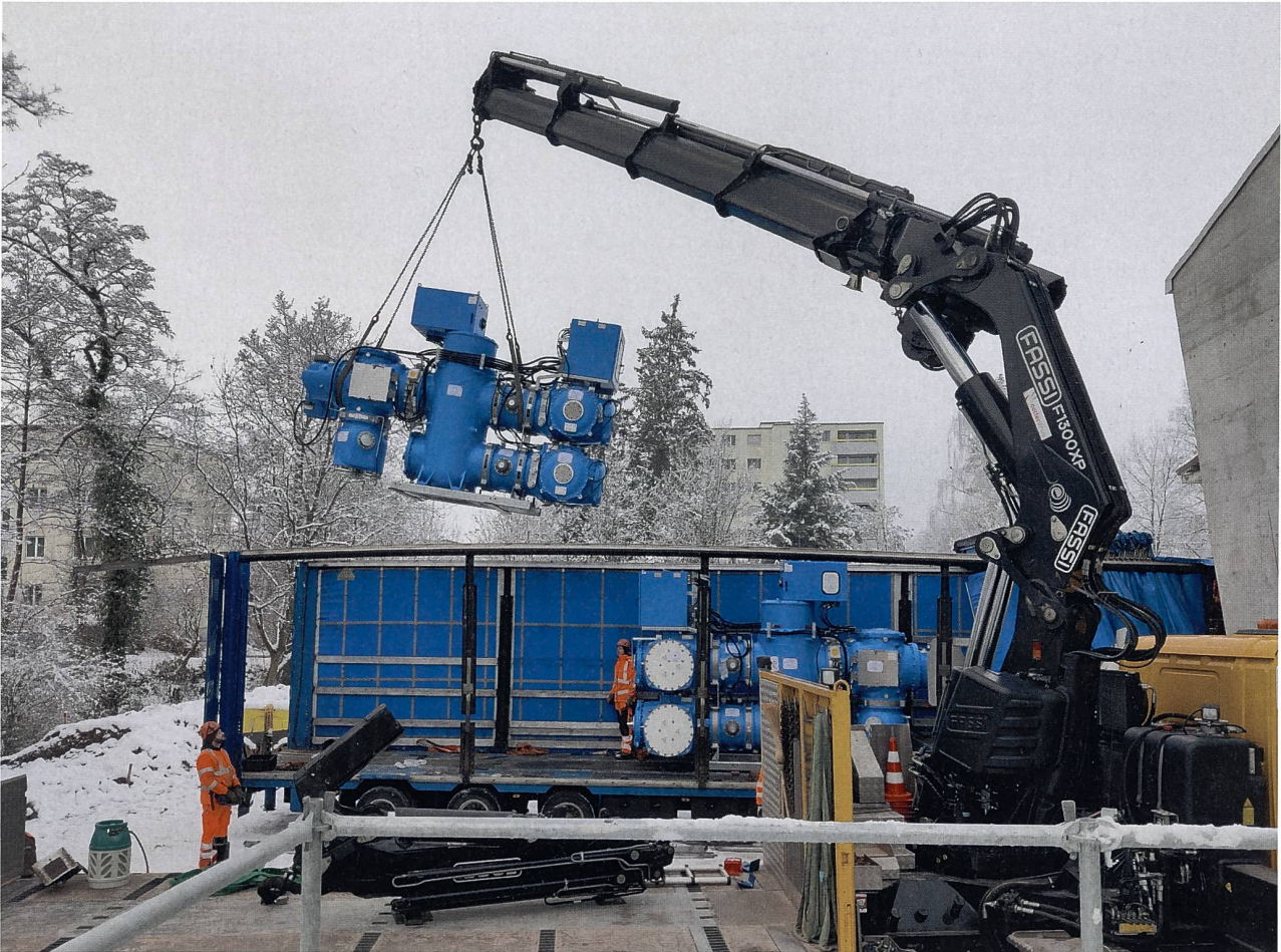
Ablad der BlueGIS für das Unterwerk Therwil im Dezember 2022.