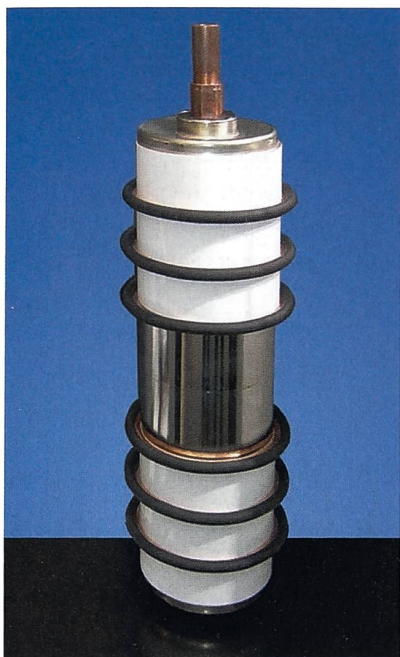
Bild 3 Die Vakuumröhre.

nisse, keine Sättigung (im Gegensatz zu herkömmlichen Stromwandlern) und keine Ferroresonanzeffekte (im Gegensatz zu konventionellen Spannungswandlern).