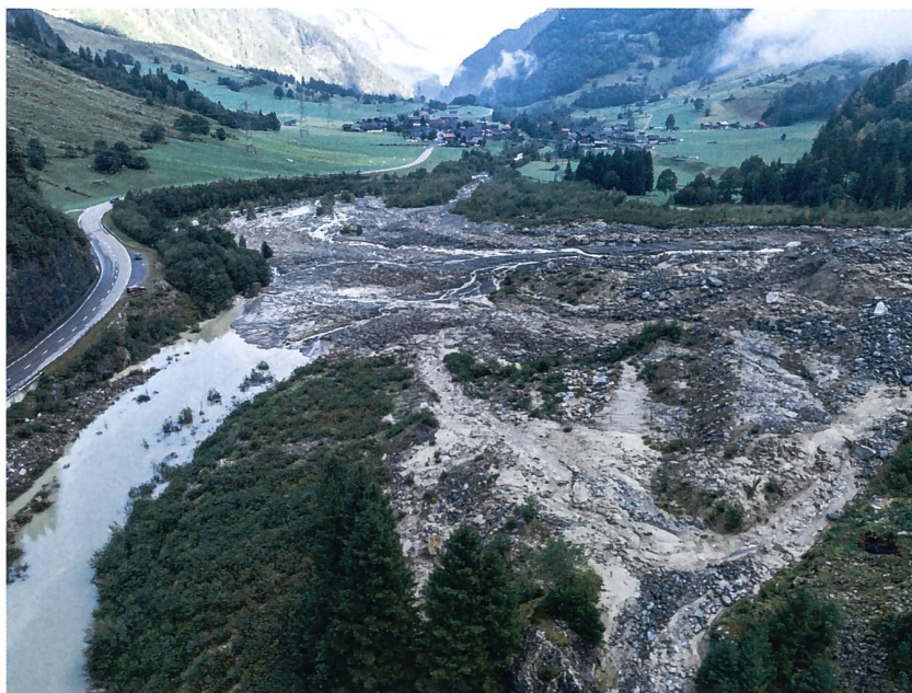
Ablagerungsraum im Tal in der Aare oberhalb Guttannen.