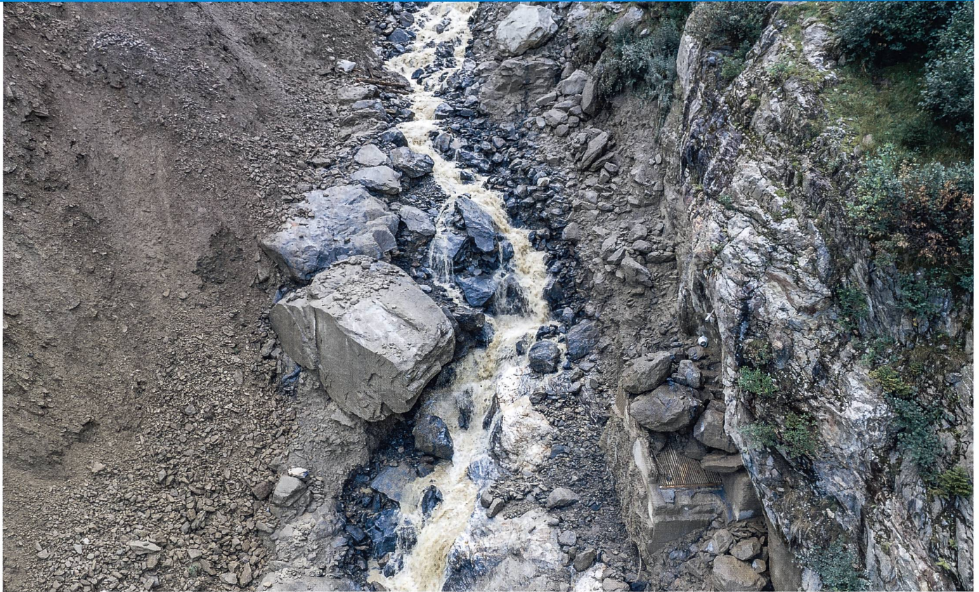
Zustand Fassung (Tirolerwehr) nach dem Murgang im August 2023.