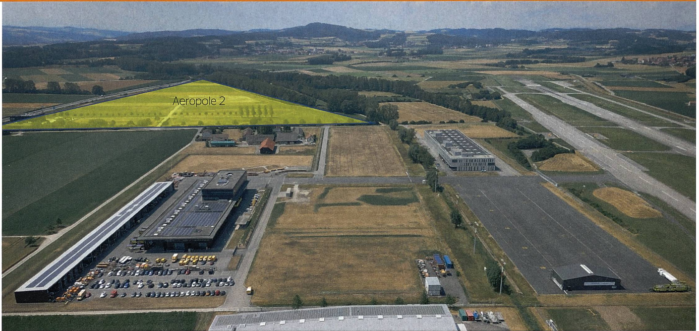
Site de la zone Aeropole 2 du parc technologique Swiss Aeropole, à Payerne.