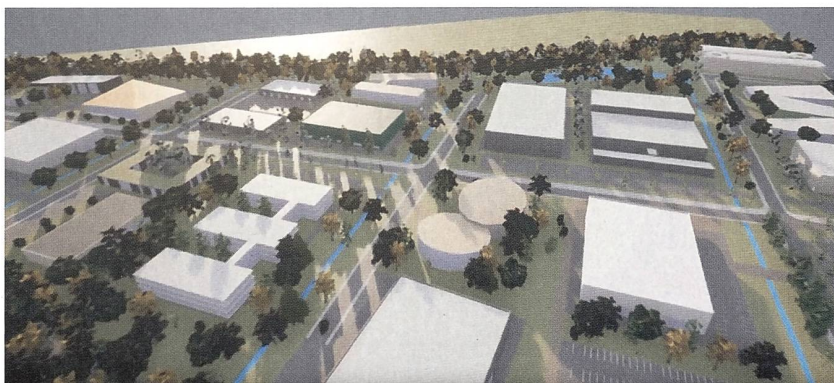
Figure 1 La zone Aeropole 2 du parc technologique de Swiss Aeropole, à Payerne, a été utilisée pour la validation du jumeau numérique développé pour la mise en œuvre du concept TaaS.

L'avantage principal de ce jumeau numérique réside dans le fait qu'il permet de tester des stratégies, de prédire des situations et de procéder à des optimisations sans perturber l'environnement réel par des tests. Par exemple, il peut être utilisé pour simu-