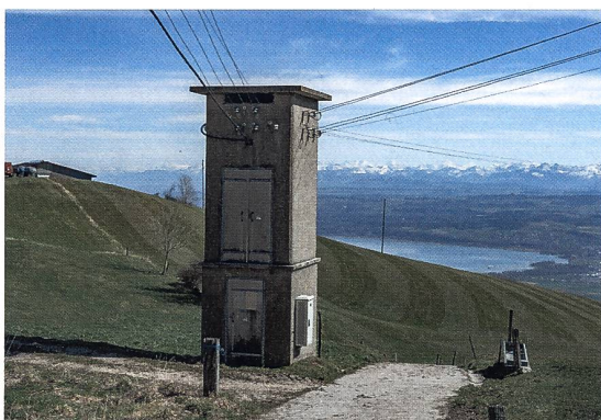
Figure 2 Le poste de boucle de réseau de distribution secondaire de Sainte-Croix.

légale de ce gaz se profile en Europe [5]. Car, pour une transition énergétique optimale, même l'électricité issue d'énergies renouvelables doit circuler sur des réseaux respectueux de l'environnement.