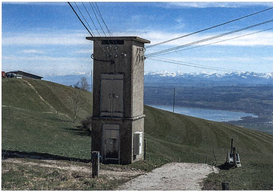
Figure 2 Le poste de boucle de réseau de distribution secondaire de Sainte-Croix.

légale de ce gaz se profile en Europe [5]. Car, pour une transition énergétique optimale, même l'électricité issue d'énergies renouvelables doit circuler sur des réseaux respectueux de l'environnement.