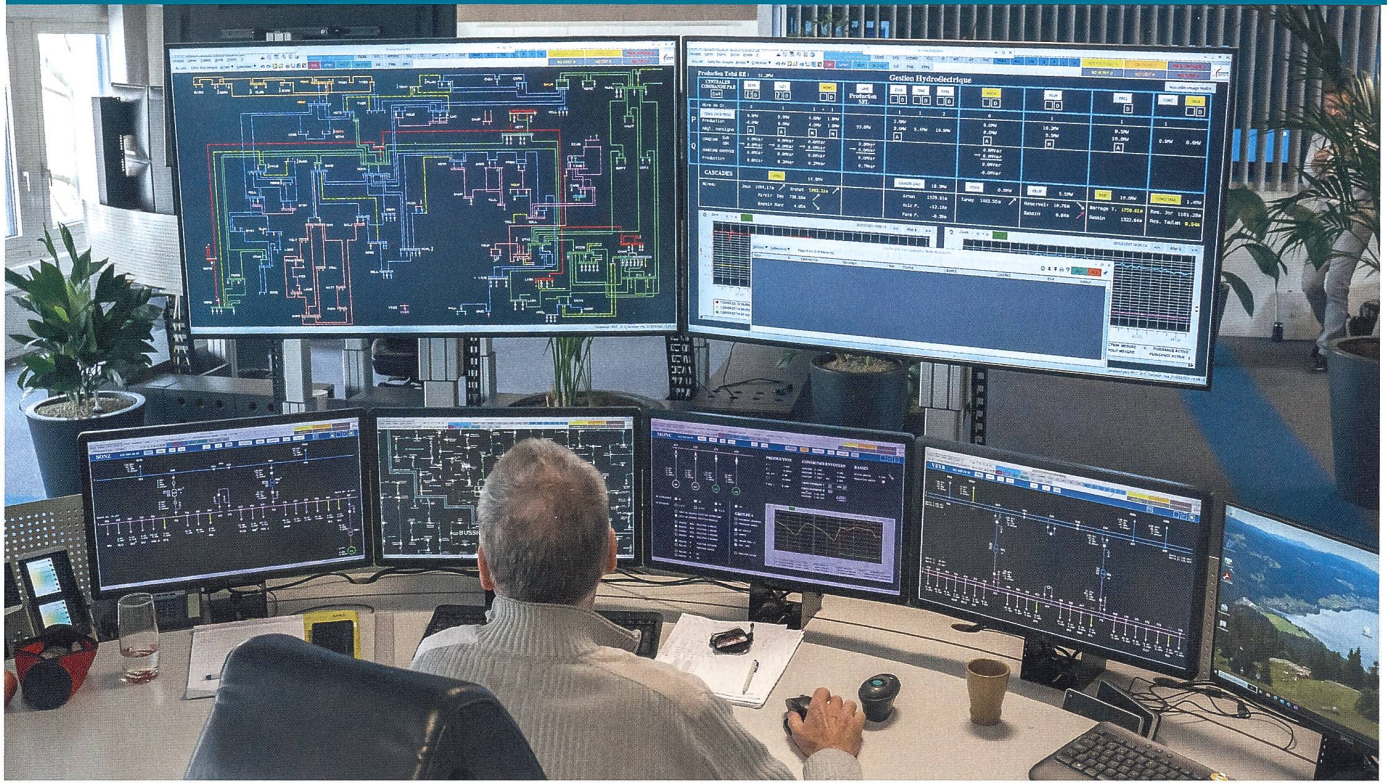
Le centre de contrôle de Romande Energie.