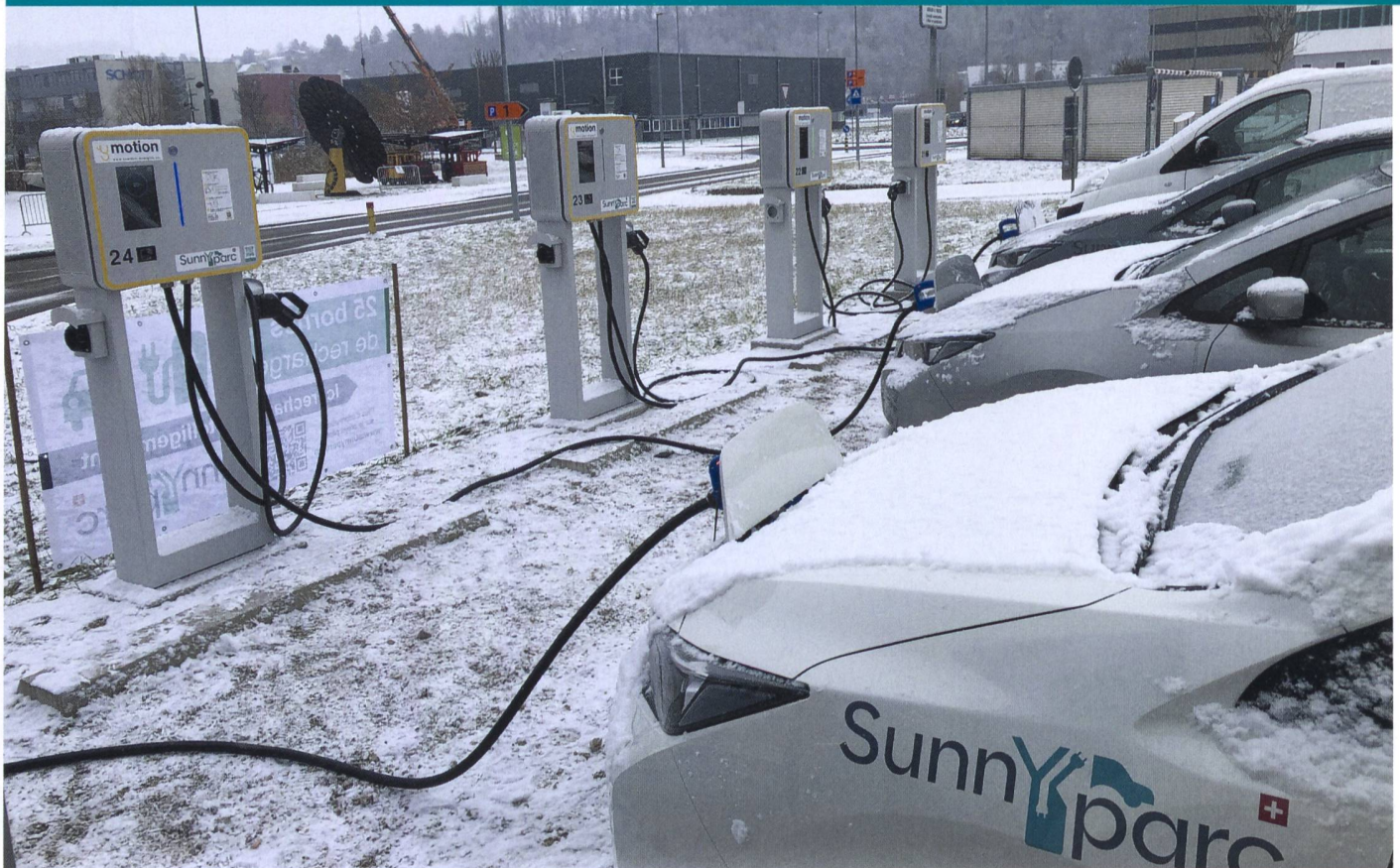
Décharge V2G simultanée de trois véhicules à 10 kW.