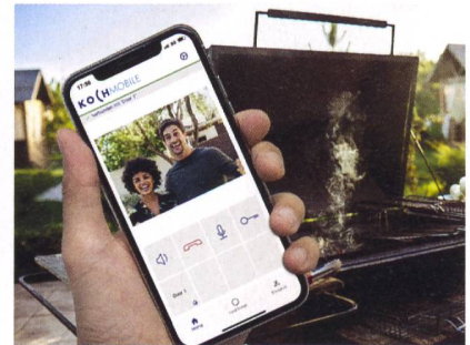
Einfach schauen, wer an der Tür klingelt.

autoSense AG, 8004 Zürich fleet@autosense.ch , www.autosense.ch/fleet