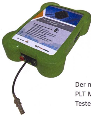
Der neue PLT M15xx- Tester.