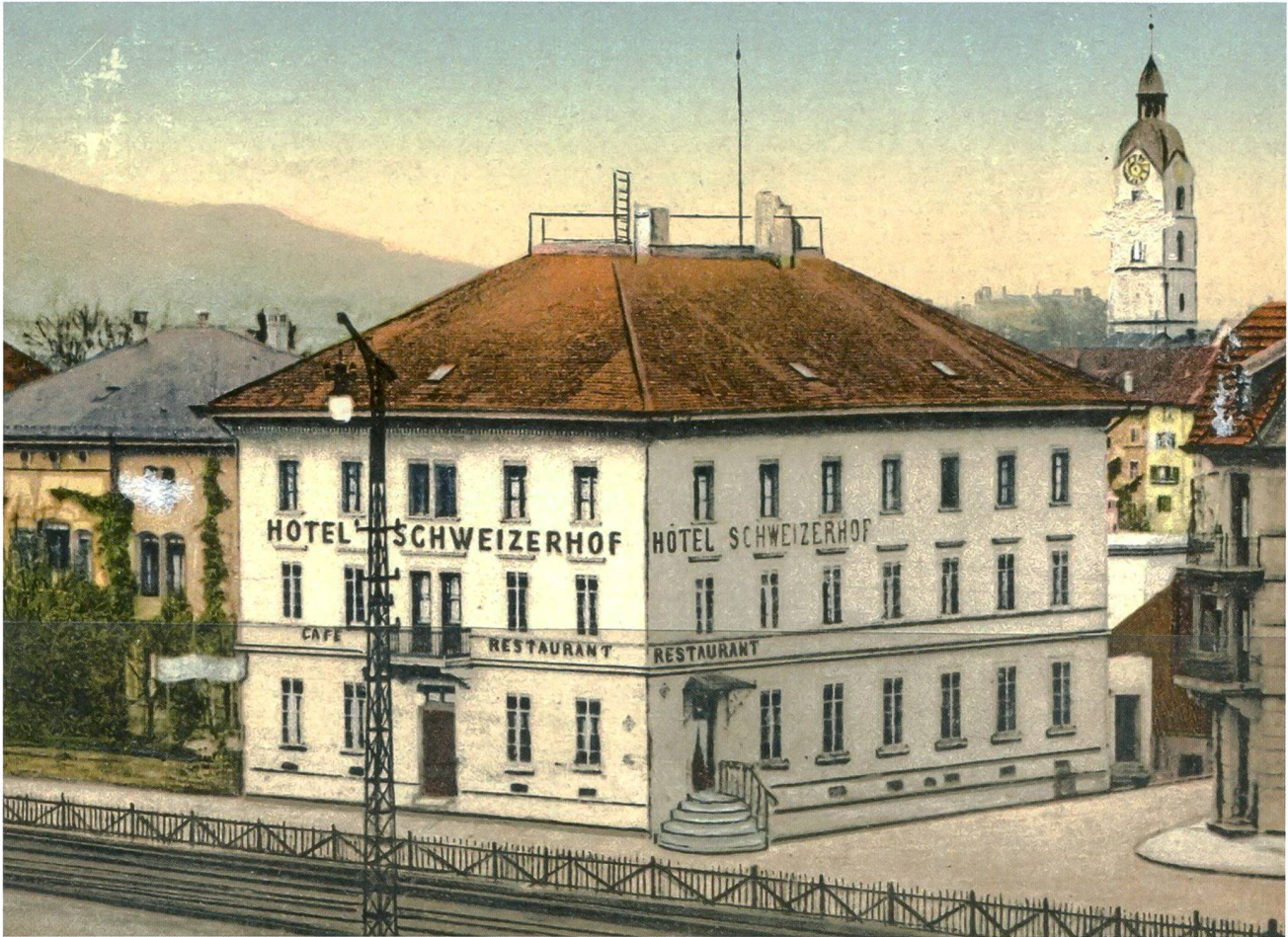
L'hôtel Schweizerhof à Olten. C'est dans cette bâtisse située près de la gare d'Olten qu'a eu lieu l'assemblée constitutive de la CPE, le 27 juin 1922. La carte postale date de 1912 environ.