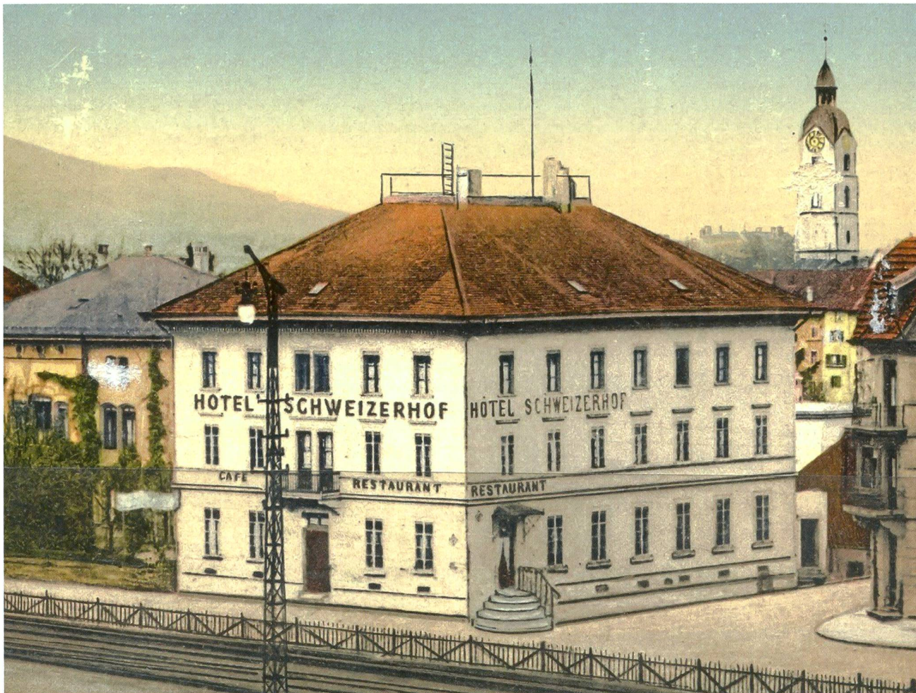
Das Hotel Schweizerhof in Olten. In diesem Haus neben dem Bahnhof Olten fand am 27. Juni 1922 die Gründungsversammlung der PKE statt. Ansichtskarte um 1912.