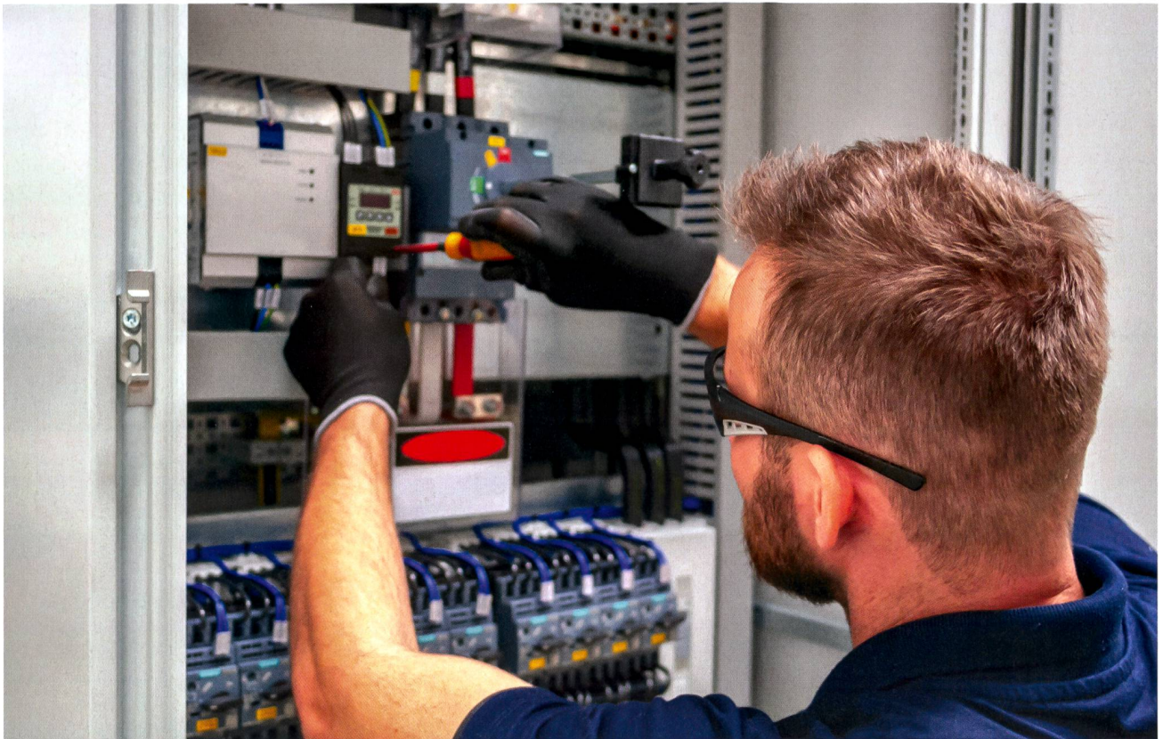
Fehler detektieren - eine Meisterdisziplin.