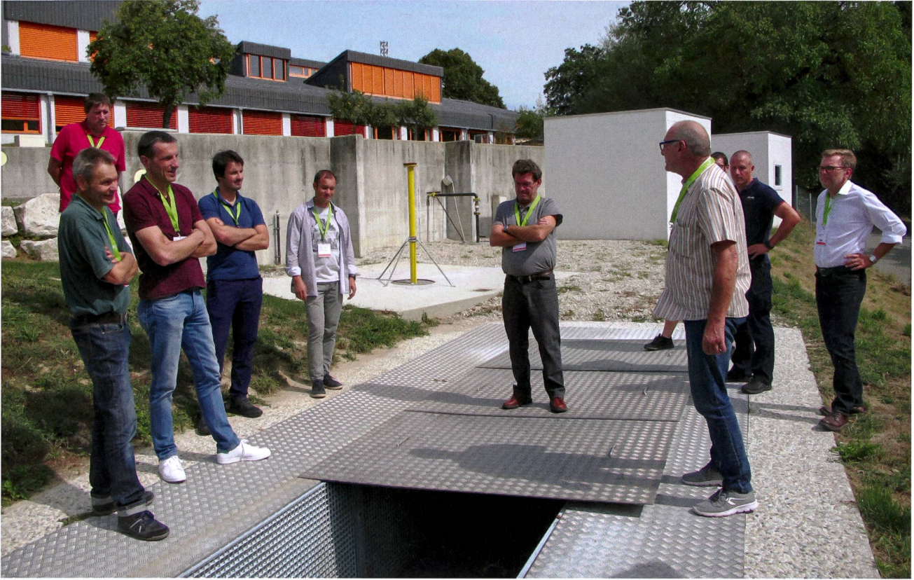
La SSIGE dispose d'installations pour les exercices d'extinction de feux de fouille.