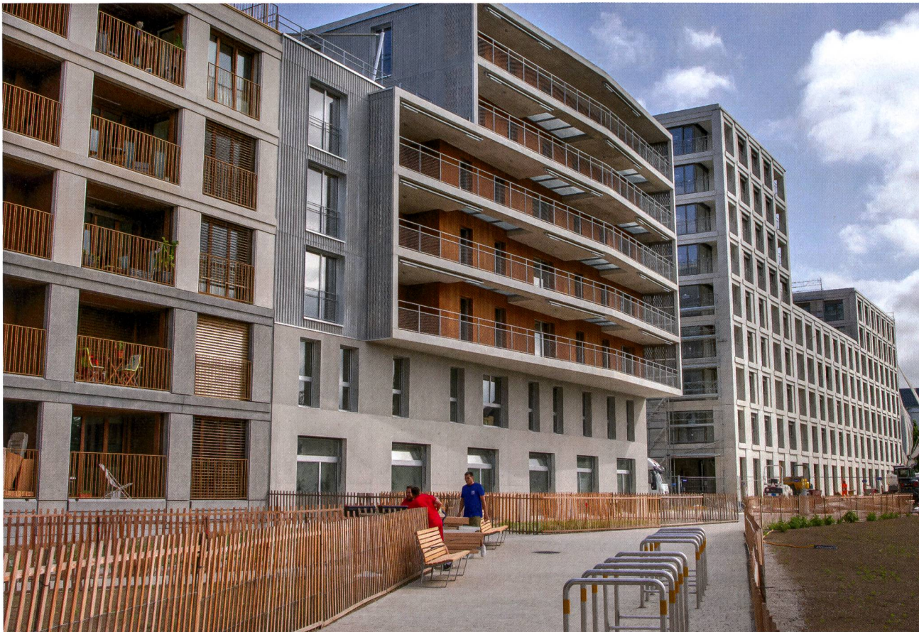
L'écoquartier des Plaines-du-Loup a été inauguré officiellement le 10 août 2022.