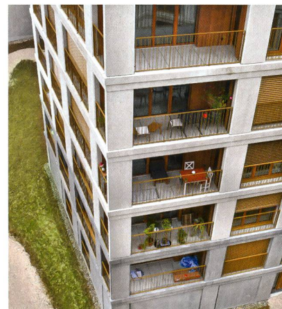
La vie a fait son entrée dans l'écoquartier.