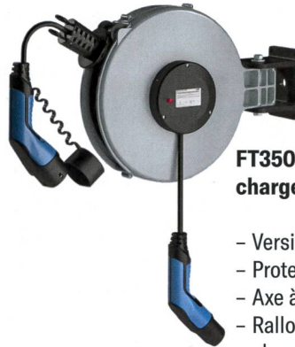
FT350 Enrouleur de câble de charge pour la Wallbox