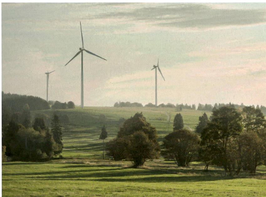
Le Swiss Energypark, région pilote servant de laboratoire en « conditions réelles ».

Les données sont exploitées dans deux types de démarches. D'une part, pour les milieux académiques, industriels ou des start-up qui souhaitent tester leurs projets en conditions réelles. Ces données permettent de déterminer le potentiel innovant de projets visant à augmenter l'autoconsommation au travers d'une campagne de test en conditions réelles dont les résultats sont comparés aux données historiques. D'autre