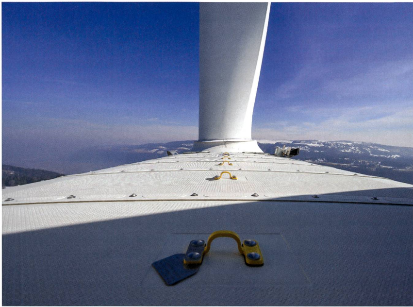
Un mix énergétique renouvelable varié qui permet de voir loin.

recours à l'échange de données ou au couplage sectoriel. Des exemples de technologies concernées par ce type de projet se trouvent notamment dans l'Internet des objets (IoT) ou les technologies liées aux blockchains.