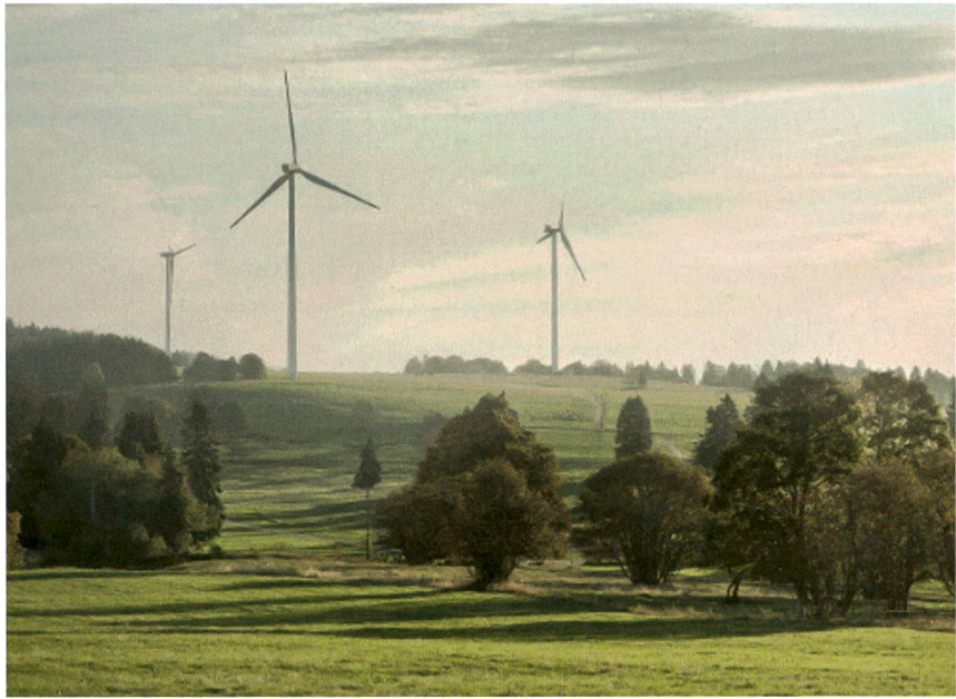
Le Swiss Energypark, région pilote servant de laboratoire en « conditions réelles ».

Les données sont exploitées dans deux types de démarches. D'une part, pour les milieux académiques, industriels ou des start-up qui souhaitent tester leurs projets en conditions réelles. Ces données permettent de déterminer le potentiel innovant de projets visant à augmenter l'autoconsommation au travers d'une campagne de test en conditions réelles dont les résultats sont comparés aux données historiques. D'autre