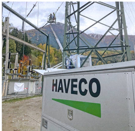
Anpassung der Leitungseinführung im UW Bitsch.

Mit Pfiffner Systems haben wir in der Schweiz einen Anbieter für Schaltanlagen-Systemlösungen etabliert, der vor