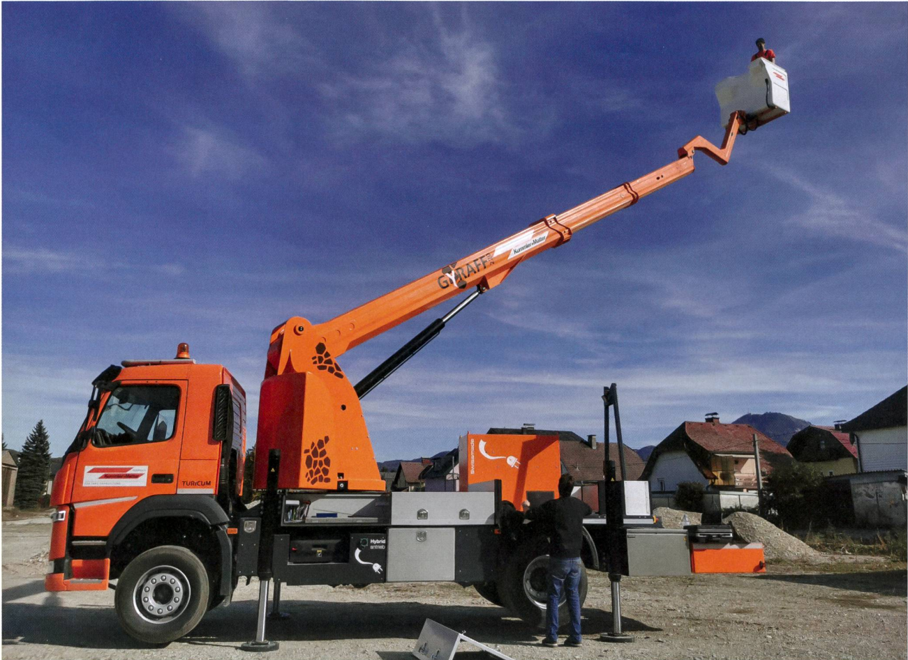
Bei Arbeiten mit der Hebebühne wird das Fahrzeug elektrisch angetrieben.