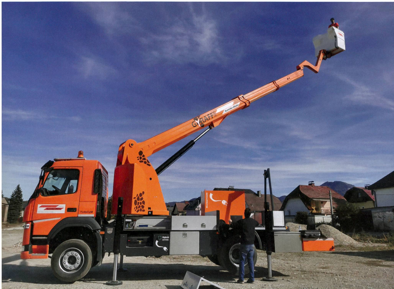
Bei Arbeiten mit der Hebebühne wird das Fahrzeug elektrisch angetrieben.