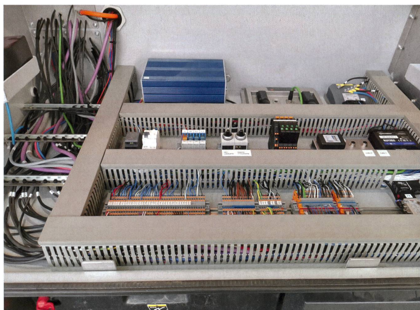
Eine Sicherheitssteuerung mit zwei unabhängigen Prozessoren und diversen Sensoren für Lage, Gewicht und Druck garantieren einen sicheren Betrieb.

und auch der Lastwagen wird zum Manövrieren mit einem elektrischen Motor ausgestattet. Es entsteht ein Lastwagen mit Hybrid-Antrieb.