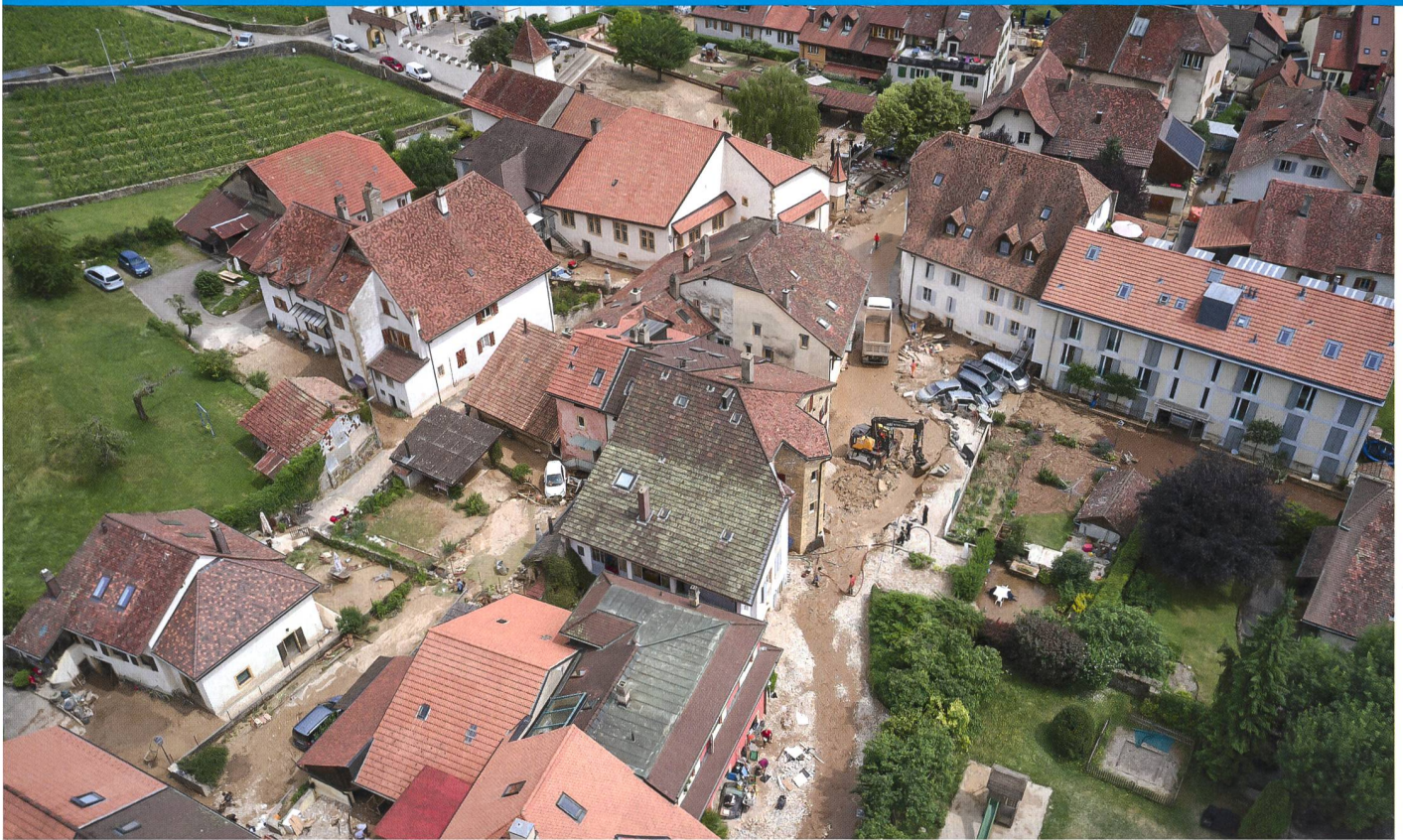
Luftaufnahme des Dorfes Cressier nach dem Gewitter vom 22. Juni 2021.