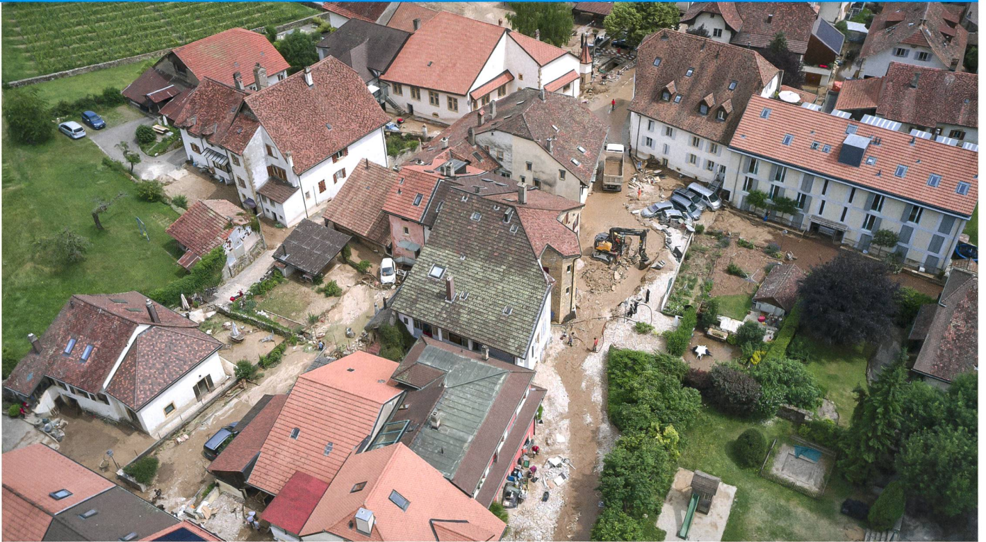
Vue aérienne du village de Cressier suite aux intempéries du 22 juin 2021.